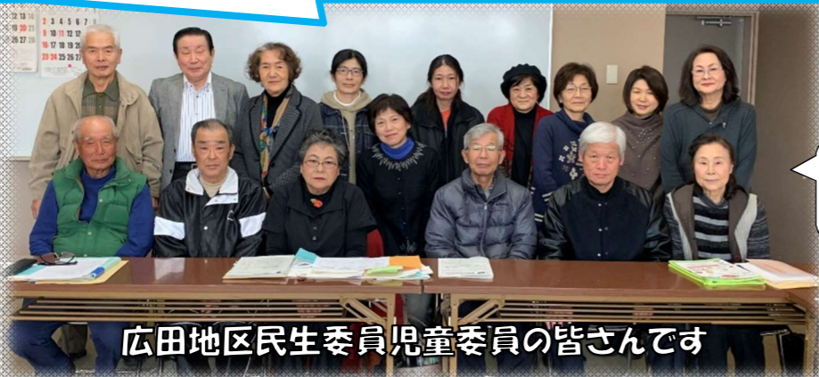
広田地区民生委員児童委員の皆さんです

3月は『ママたち広田』はお休みです。また『ママたち広田』は今年度を以て終了させていただくこととなりました。今までご利用いただき、ありがとうございました。