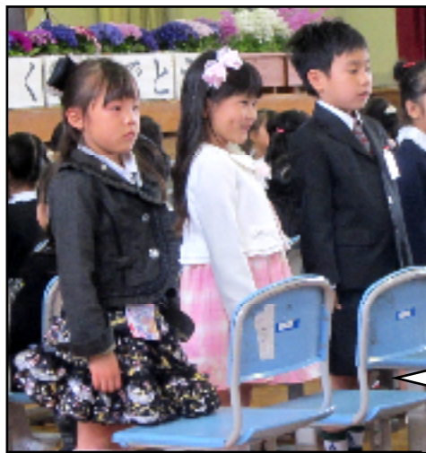
4/8（金）広田小学校入学式

4/7（木）に広田中学校、4/8（金）に広田小学校の入学式が行われました。広田中学校の入学式はあいにくの雨模様となりましたが、新中学1年生164名と新小学1年生181名の初々しい顔ぶれが、満開に咲き誇る桜の花のように校内をパッと華やかな雰囲気にしてくれました。これから始まる新しい生活に胸を膨らませる新入生たちの活躍を地域の皆様と共に期待しています。高い志と目標をもって頑張っていって下さい。そしてたくさん友達を作って毎日笑いのたえないような楽しい学校生活を送って下さい。